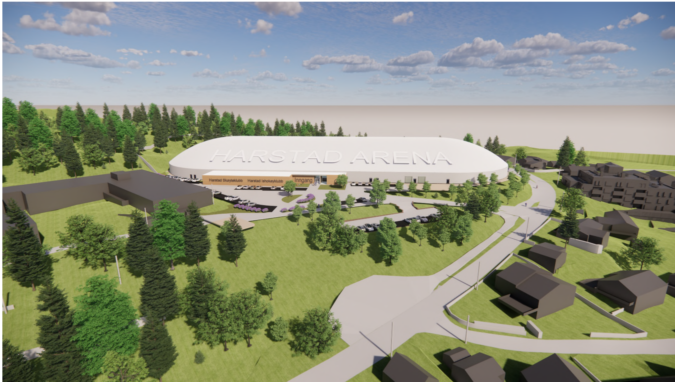
Fugleperspektiv mot sør 1 : 1