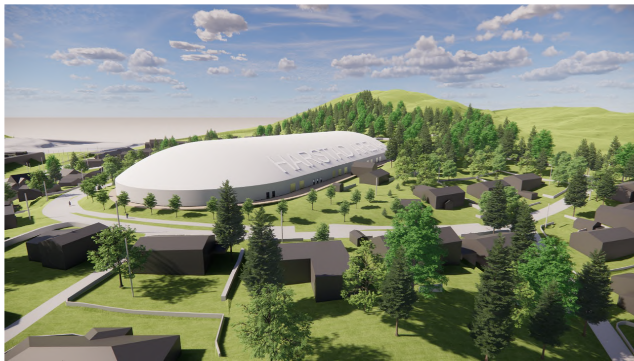
Fugleperspektiv fra nordøst 1 : 1