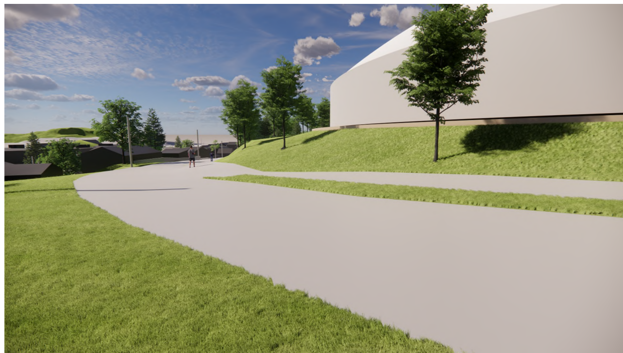
Steinveien 49 mot sør 1 : 1