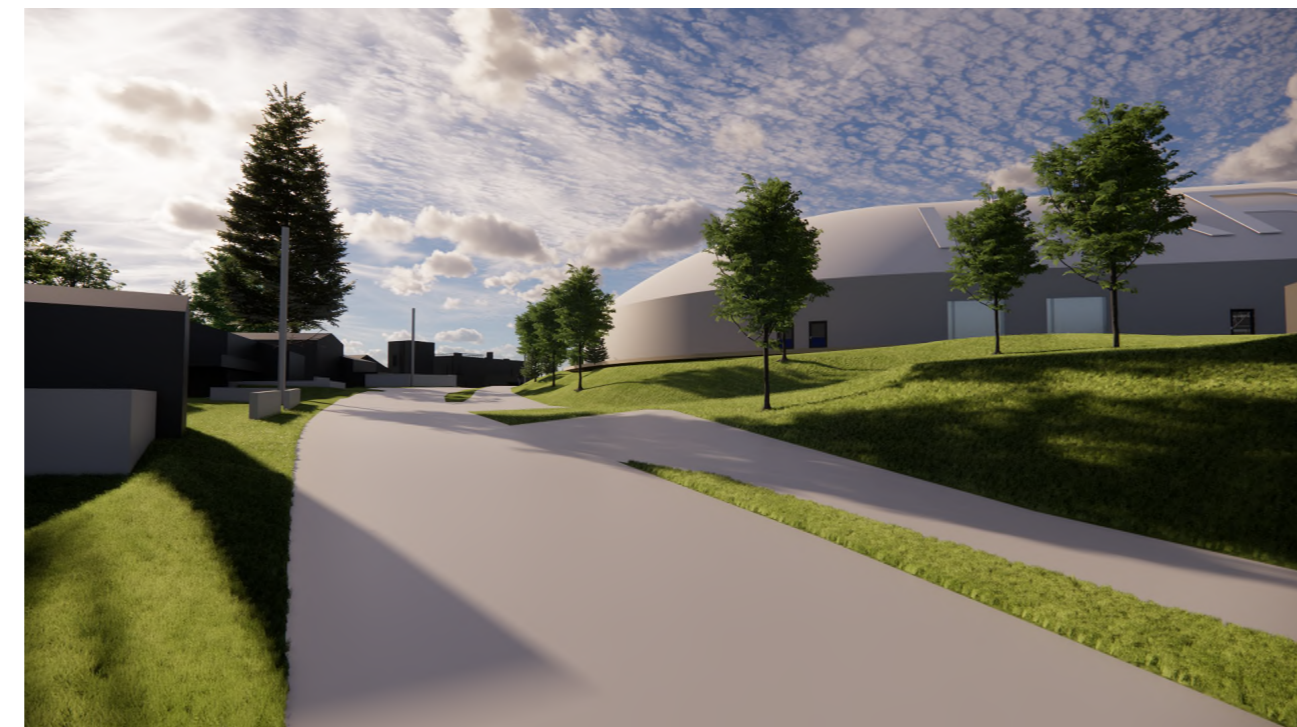
Steinveien 39 mot sør 1 : 1